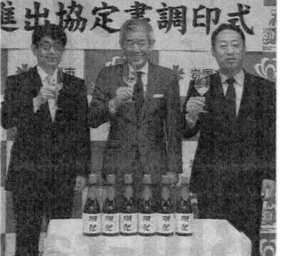
調印を終えて瀬祭で乾杯する(右から) 岩国市長、桜井社長、木村県商工労働部

旭酒造(岩国市周東町)は22日、同社敷地内に約25億円投資で12階建ての新酒蔵を建設することを発表した。生産能力を今の約3倍に高める。巧み々とした戦略により海外でも販路を伸ばしており、事業拡大に踏み出す。(野田華奈子) 旭酒造(岩国市周東町)は22日、同社敷地内に約25億円投資で12階建ての新酒蔵を建設することを発表した。生産能力を今の約3倍に高める。巧み々とした戦略により海外でも販路を伸ばしており、事業拡大に踏み出す。(野田華奈子)